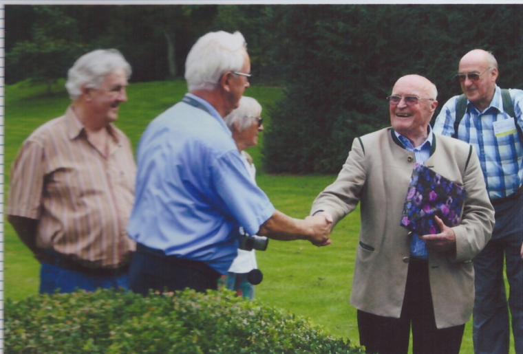
Kirche und Schlossparkführung mit Graf von und zu Bodman.