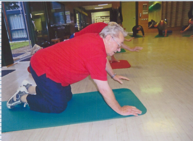
Die MED: Trainings - Therapie