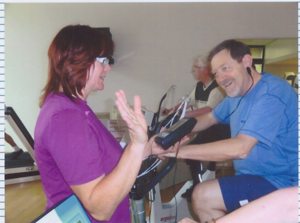
Genau gemessen wird von unserer Therapeutin der Puls nach jeder noch so kleinen Anstrengung.