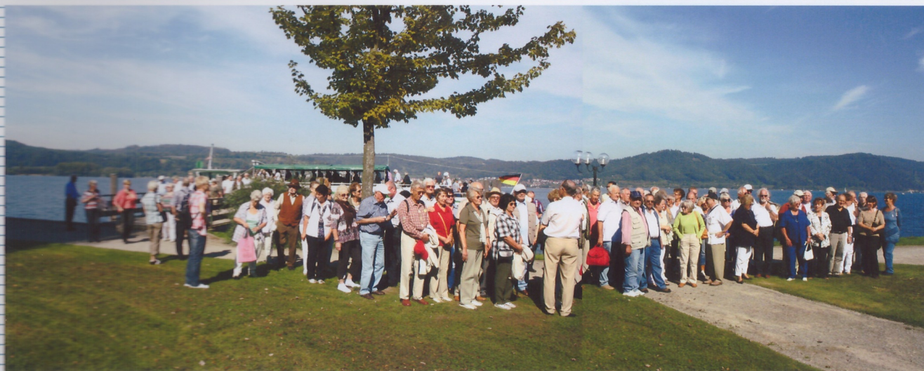
Eine große Gruppe über den See nach Bodman.